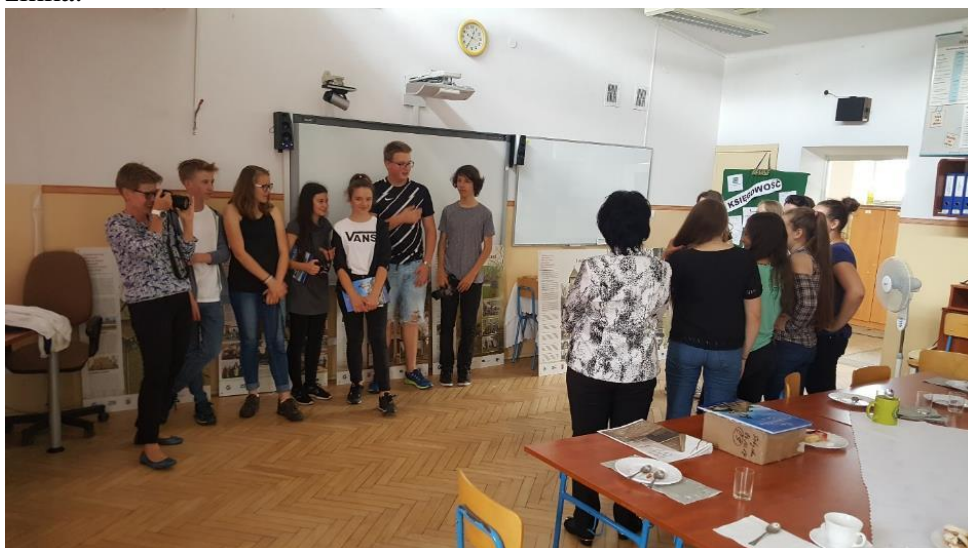
(setkání s polským projektovým týmem v partnerské ZSE Gorlice)

V rámci uvedeného projektu jsme v červnu 2018 navštívili jihopolské město Gorlice, dále Krakov s jeho židovskou čtvrtí Kazimierz a především nacistický vyhlazovací tábor Osvětim a Březinka.