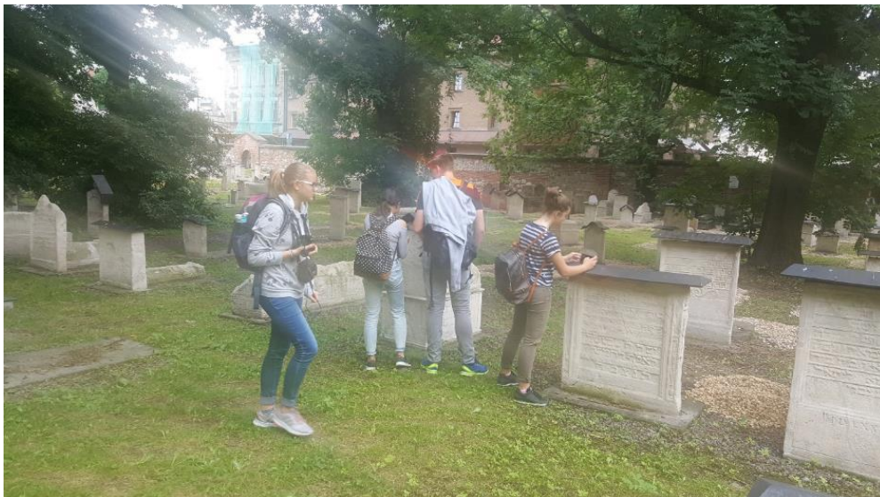
(židovský hřbitov v Krakově)