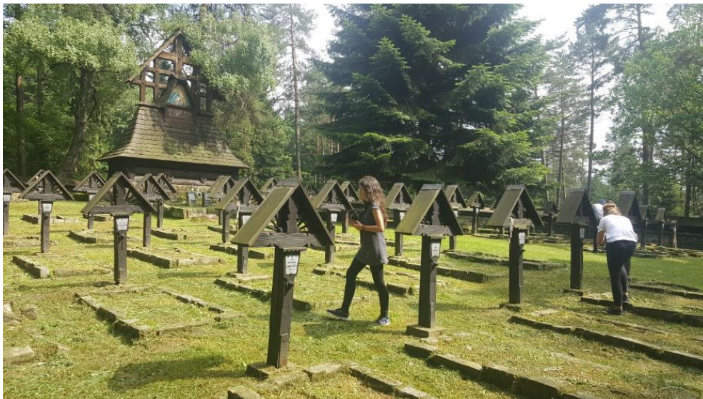
(vojenský hřbitov vojáků I. světové války, Malastow, jižní Polsko)