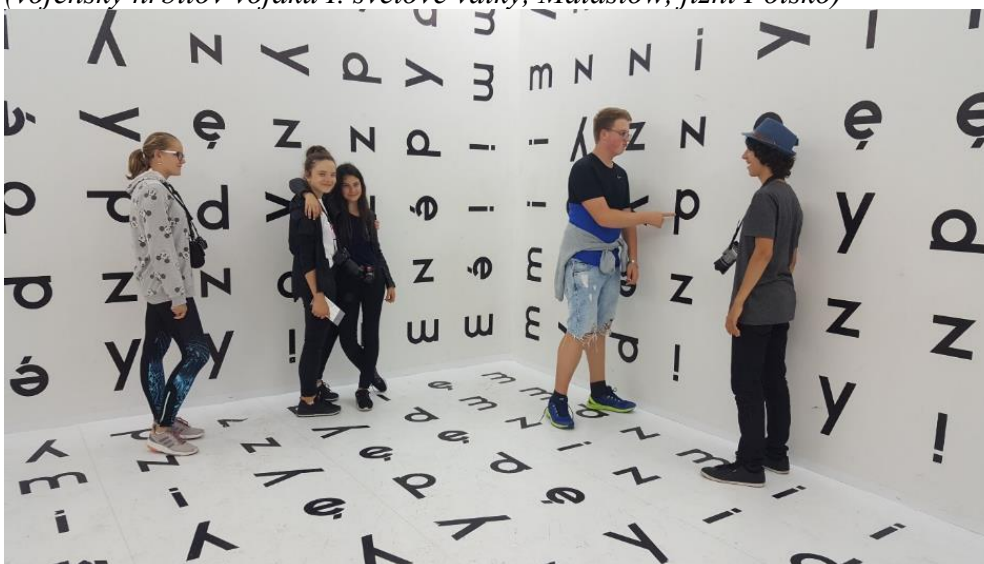
(Art Galerie Krakov)